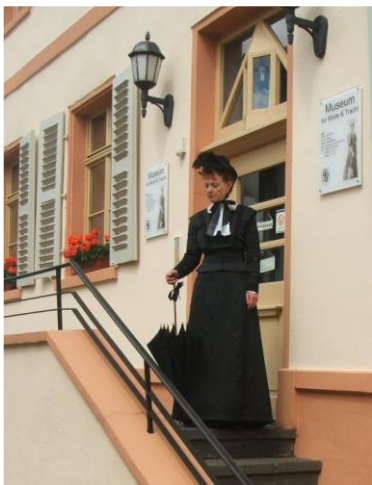
Museum für Mode und Tracht Nohfelden